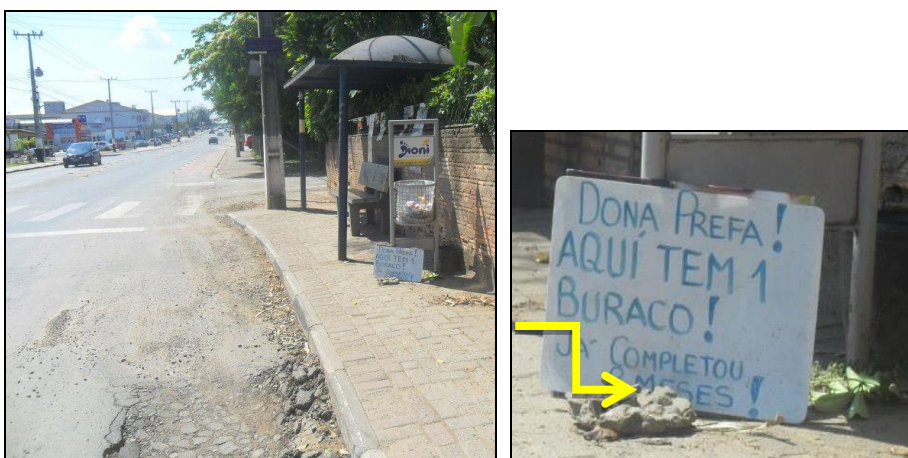
Figura 3: Ação de uma moradora para que a prefeitura tome providência na melhoria das condições da rede viária no detalhe a reivindicação

No que diz respeito às condições dos espaços públicos disponíveis no bairro Santa Luzia, os entrevistados reclamaram que as ruas e calçadas estão em péssimas condições. Uma moradora por iniciativa própria tenta chamar a atenção do poder público municipal quanto ao problema, colocando placa nos buracos da via conforme registro representado na figura 3.