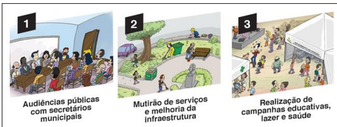
Figura 4: Fases do projeto viva o bairro da Prefeitura de Santos - SP

ilustrado na figura 4 que segue abaixo é dividido em três etapas para poder concretizar os objetivos propostos nas reuniões.