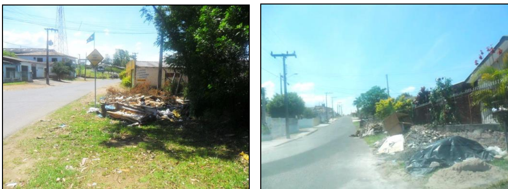
Figura 2 – Entulhos depositados em vias públicas e terrenos baldios

Nas incursões sistemáticas e esporádicas pelo bairro, o que também chamou a atenção do autor, retratado na figura 2, foi o acúmulo de resíduos sólidos depositados nas calçadas e nos terrenos baldios. Este descaso com o espaço de uso comum revela o desrespeito da população com esses espaços públicos, a ineficiência das empresas de coleta de lixo e limpeza pública das vias e cabe aqui ressaltar que este lixo não destinado corretamente cria obstáculos nas calçadas prejudicando o fluxo dos pedestres e a imagem do bairro.