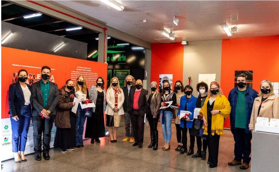
Figura 01 - Artistas e Gestores da UNESCO na Exposição do IV Coletiva de Artistas do Sul