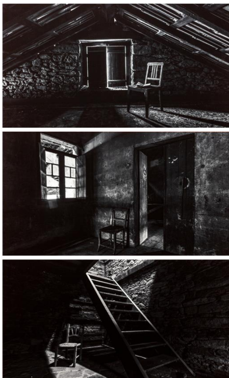
Figura 05 - Produção “Rastros” do artista Zé Ronconi (2020)