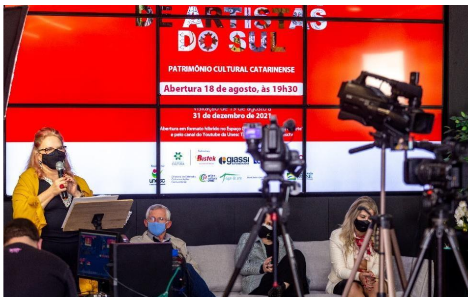
Figura 03 - Cerimonial de abertura da IV Coletiva de Artistas do Sul