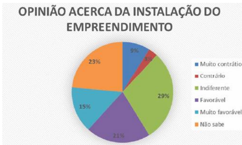
Gráfico 2. Opinião dos moradores sobre a instalação do Terminal Portuário em Abaetetuba-PA.

Nesse sentido, nota-se que o RIA apresentado pela empresa mostra inclusive uma pesquisa sobre a opinião da população local, não plenamente respeitada, acerca da instalação do empreendimento, conforme exposto no Gráfico 2 .