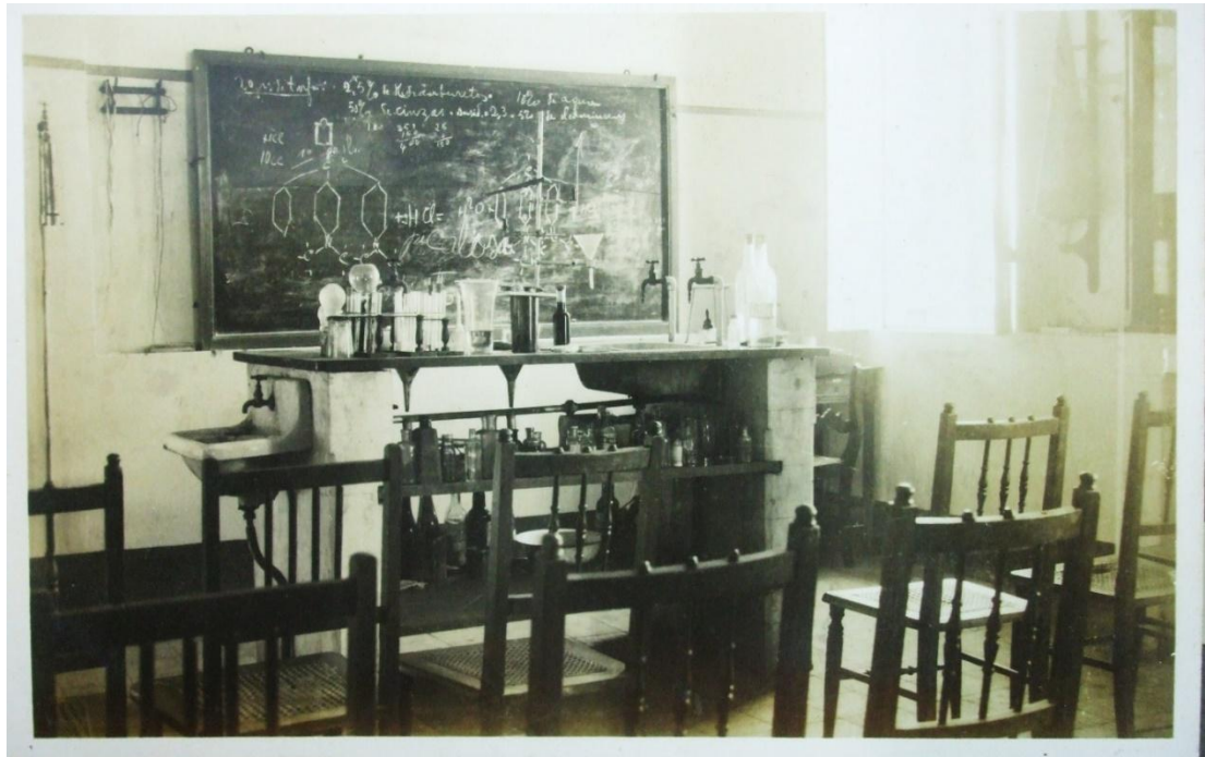
Figura 1: Laboratório de Química, 1932.