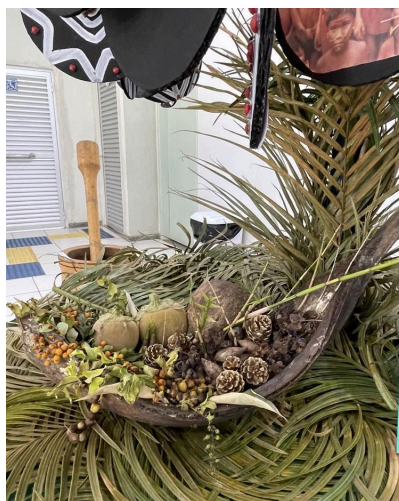
Figura 4. Obra: Suspende o céu