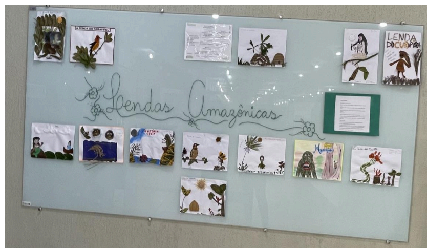
Figura 6. Obra: Painel de Lendas Amazônicas

Ainda, em valorização às artes dos povos indígenas da região, objetos de cestaria e demais produções, representam os processos tecnológicos dos povos tradicionais. Parece lugar comum, via senso comum, a ideia dicotômica de que tecnologia necessariamente seria apenas as produzidas pelas grandes corporações, por exemplo. É preciso dessacralizar essa narrativa de tecnologia e desvelar preconceitos, conforme provoca Canda et.al. (2018), a fim de que haja o despertar para aquilo que nem novo é, uma vez que aqui, no território amazônico, já transitavam tecnologias e existências corporais não separadas da ecologia planetária (Mendonça, 2022). Pensando nisso, temos a obra ‘Painel de Lendas Amazônicas’ (Fig. 6), materializada com o recurso de recolhimentos de elementos diversos capturados dentro do espaço do campus , para representar algumas lendas amazônicas, como podemos perceber no detalhe da Figura 7.