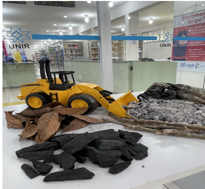
Figura 1. Obra: Progresso para quem?