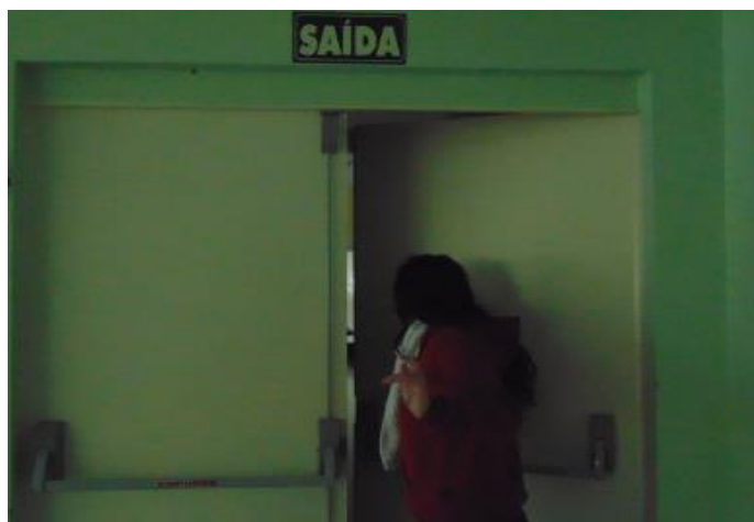
Imagem 2 - Novo começo

Torna-se interessante observar a escuridão dessa escada e o ponto de luz acima, o que nos faz lembrar da transitoriedade apresentada por Dayrell (2003) e a escuridão que perpassa a juventude citada por Schwertner e Fischer (2012). Além de ser uma visão que desvaloriza a juventude, percebemos que os jovens também têm se colocado nesse lugar de “corredor escuro”, de transitoriedade, de um “vir a ser” que ainda não é possível neste momento da vida – mais adiante, quem sabe, após a passagem pela “saída”. Saída a qual é apresentada novamente na fotografia a seguir, produzida pela estudante 9: