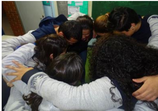
Imagem 5 - Todos abraçados, momentos que passamos juntos vai ficar para sempre

As últimas duas fotografias apresentam o papel social da escola, defendido com intensidade entre os estudantes, a valorização das relações interpessoais que construíram ao longo dos anos escolares, que para eles se tornou uma marca da escola.