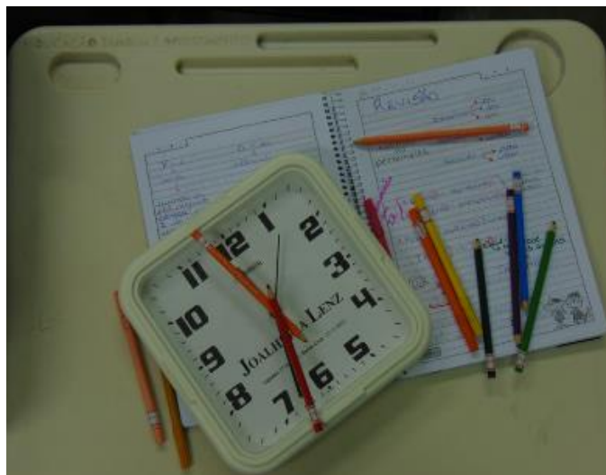
Imagem 3 - Mesmo correndo o conteúdo nunca se atrasa