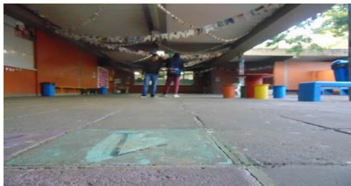
Imagem 6 - Amizades concretas

Na fotografia a seguir, os estudantes seguiram a discussão sobre as relações interpessoais, principalmente aquelas consideradas “amizades concretas”: