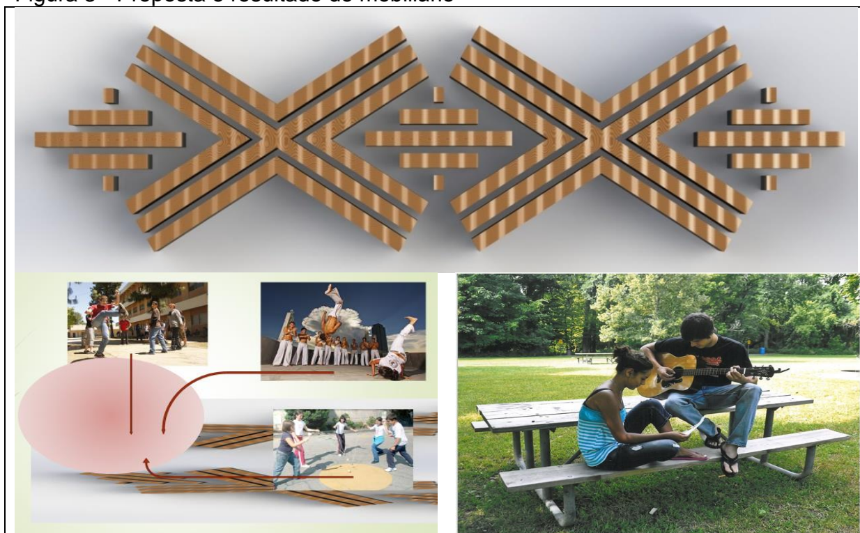
Figura 3 - Proposta e resultado de mobiliário