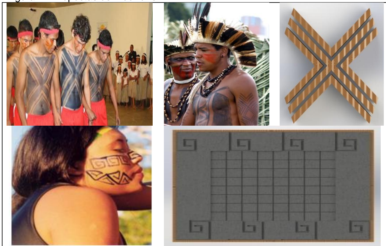
Figura 2 - Propostas de mobiliário