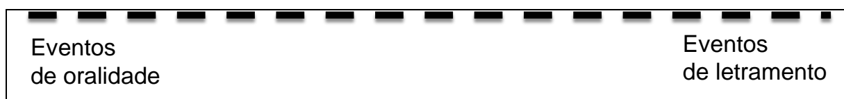
Figura 2 – O Contínuo de oralidade-letramento

Fonte: Adaptado de Bertoni-Ricardo (2009)