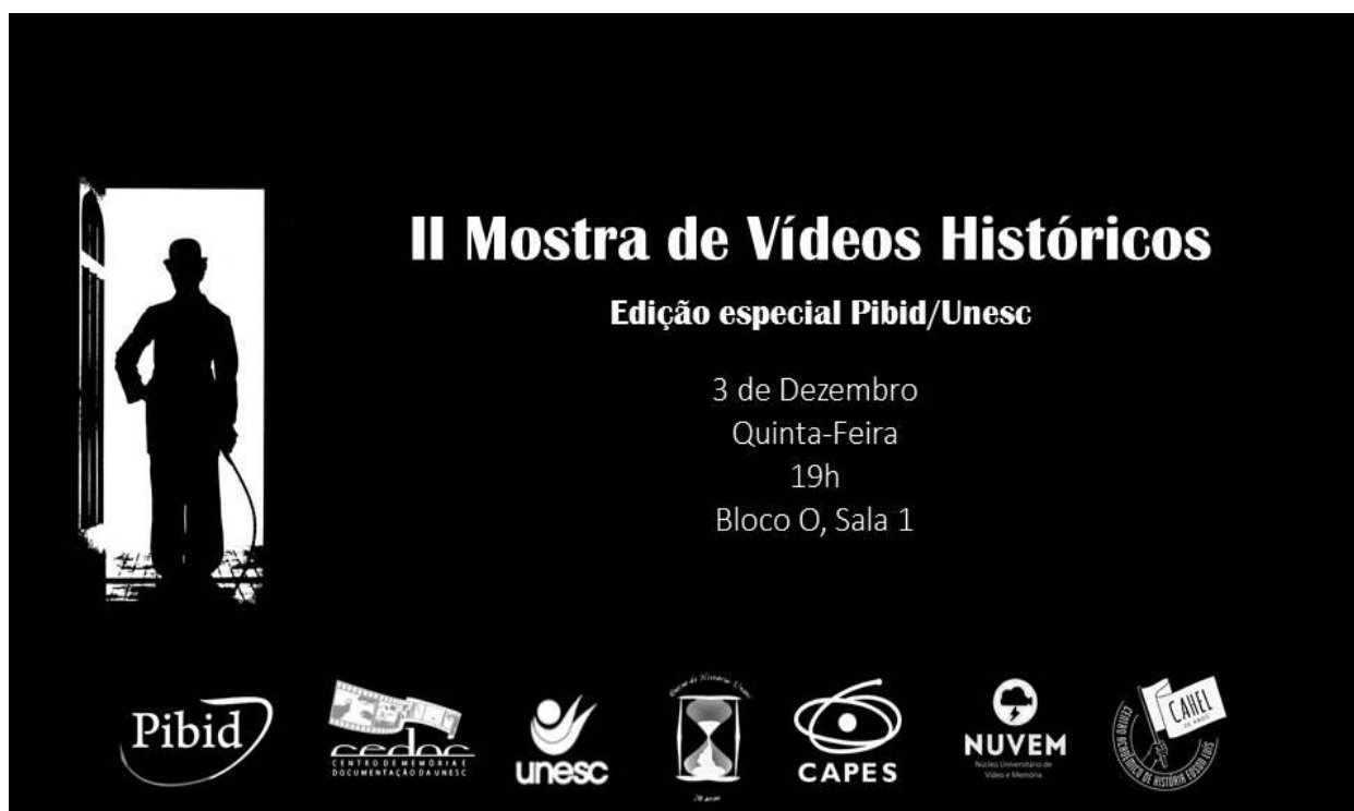
Foto: coordenação curso de História – divulgação do evento em 2015.