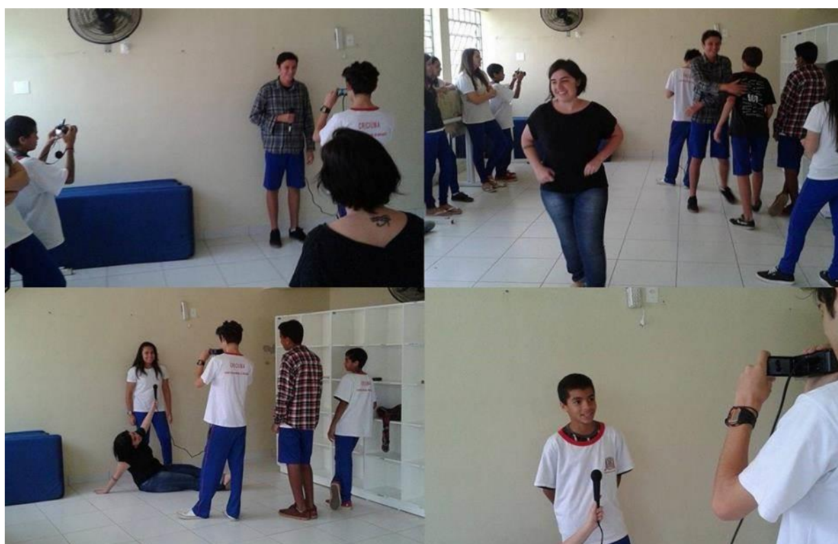
práticas em imagem e som: produção do audiovisual com a turma 903 - 2015.

É importante ressaltar que embora o projeto tenha tido um recorte de gênero para a construção das narrativas e das questões pertinentes ao nosso subgrupo