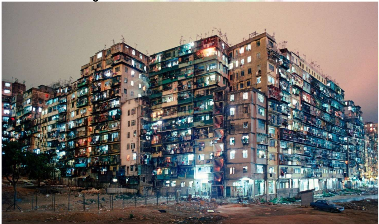
Imagem 2. A Cidade Murada de Kowloon iluminada

A fiação elétrica era improvisada e com conexões perigosas, causando incêndios e choques, perante as captações ilegais de energia da rede elétrica geral porque não havia um projeto básico governamental. Foi legalizado apenas no final da década de 1970, diante de um grave incêndio que devastou a cidade (Fernández; Sotés, 2023). Não havia interferência governamental e, por tal razão, era ínfimo o fornecimento de serviços essenciais como saneamento básico, acesso à água, coleta de lixo e eletricidade – estes serviços eram disponibilizados às margens da cidade de forma enjamburada e limitada (SCMP, 2024).