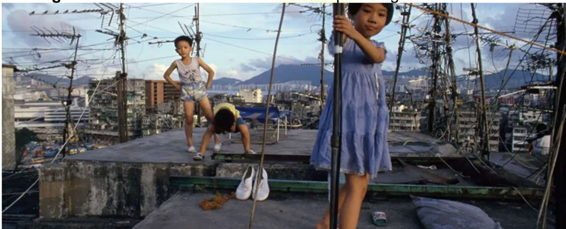
Imagem 6. “Cidade das Trevas Revisitada” por Greg Girard e Ian Lambot

Em relação as unidades residenciais, elas eram pequenas e frequentemente compartilhadas por múltiplas famílias. A falta de espaço levou à criação de tipologias híbridas, não adaptadas à classificação urbana convencional ou à delimitação de uso e privacidade. O espaço era utilizado de forma criativa em uma confusão nas distinções entre unidades habitacionais e corredores, interior e exterior, público e privado. As vielas de Kowloon além de serem caminhos que conectavam os vários edifícios e moradias, serviam como espaços sociais e culturais. Em muitos becos eram localizadas lojas, restaurantes e empresas que forneciam bens e serviços essenciais à comunidade e eram administrados por famílias, transmitidos de geração em geração, criando um senso de continuidade e tradição. Estes eram palcos de atividades que fortaleciam os laços sociais e o sentimento de pertencimento. Nos terraços as crianças brincavam e se beneficiavam da luz natural e do ar fresco (Fernández; Sotés, 2023).