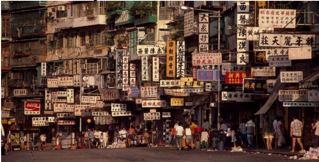
Imagem 4. O comércio exterior de Kowloon