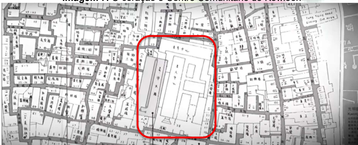
Imagem 7. O coração e Centro Comunitário de Kowloon

No centro da cidade estava um pátio que servia de Centro Comunitário, sendo um coração social da comunidade onde era possível ver o céu e sentir o ar puro. Este pátio havia sido estruturado envolta do Escritório de Yamen, que havia sido construído no antigo forte militar em 1845 – local que passou por diversas ressignificações de vieses religiosos cristãos e evangélicos, escolas e centros de convivência de idosos; mas permaneceu preservado e a sua herança mantida. Era um espaço essencial para a comunidade não passível de interferências, novas construções ou grandes modificações estruturais (Lee, 2024).