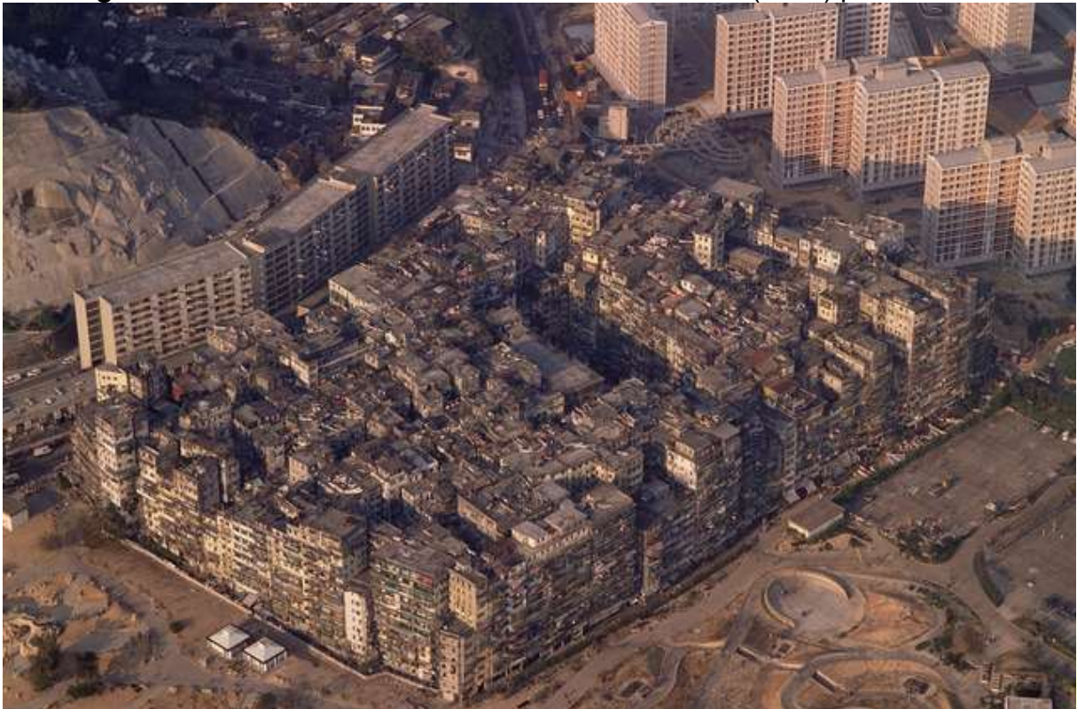
Imagem 1. Visão aérea da Cidade Murada de Kowloon (1990) por Ian Lambot