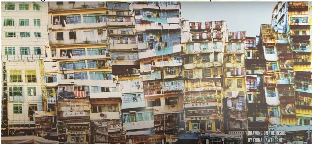
Imagem 3. Kowloon em “Desenhando de Dentro” por Fiona Hawthorne

O apagamento era tamanho que não existia nenhum relatório afirmando que os prédios de Kowloon eram inseguros ou estruturalmente defeituosos, mesmo depois que o governo colonial considerou a possibilidade de desabamentos, incêndios ou surtos de doenças. Diante dos prédios estarem tão compactados e juntos, acabaram formando uma estrutura estável que se mantinha firme. E por ser um assentamento residencial, era proporcionado uma qualidade de vida superior em Kowloon quando comparada aos seus lares anteriores, conforme expõem moradores. Deve-se reforçar, neste aspecto que não existe uma definição fixa e universal a respeito de “qualidade de vida”, pois esta é moldada cultural, histórico e socialmente – incluindo saúde física e mental, bem-estar, satisfação, família, trabalho, moradia, relações sociais, vida política e cultural, ética social e entre outros (Kwok et al , 2018).