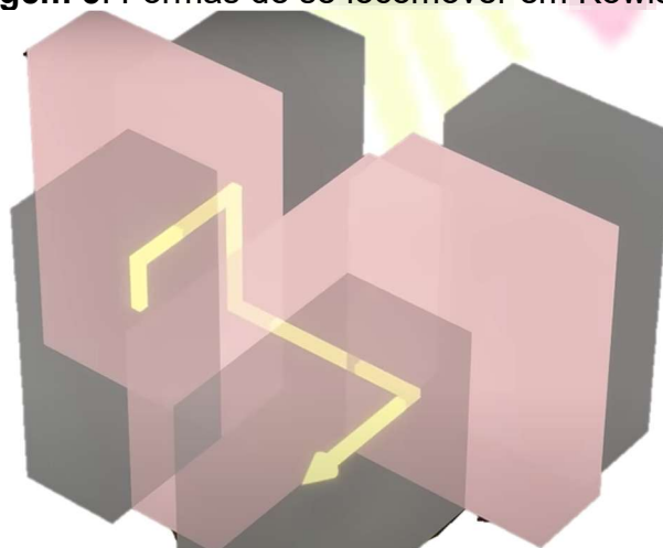
Imagem 5. Formas de se locomover em Kowloon

Pesquisadores começaram a questionar a aplicabilidade do conceito Rhizome , que seriam como as raízes profundas e intrincadas de uma planta que não há como localizar ou direcionar o seu final ou início com partes interconexas, existindo múltiplas conexões sem uma estrutura fixa. No caso da Kowloon, as construções iniciais deixavam pequenos espaços para locomoções, ar e luz (as ruas, becos e vielas), mas logo estes espaços também eram preenchidos com mais prédios, aos poucos transformando os prédios separados em uma única construção completamente interligada. Os telhados eram unificados e as residências também (Alsuwaidi et al , 2024).